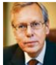
Mats Odell Kommun- och finansmarknadsminister, Regeringskansliet.

De senaste åren har man genomfört en rad insatser för att höja e-förvaltningens samlade kvalitet och tillgänglighet. Numera kan alla myndigheter ta emot och skicka e-fakturer. Ett införande av gemen-