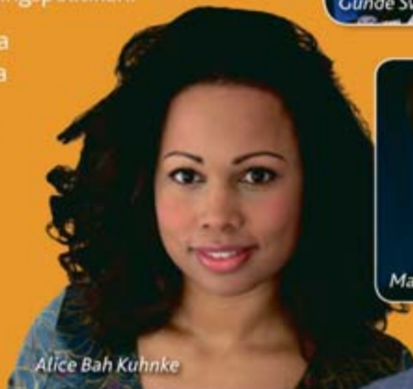
Alice Bah Kuhnke