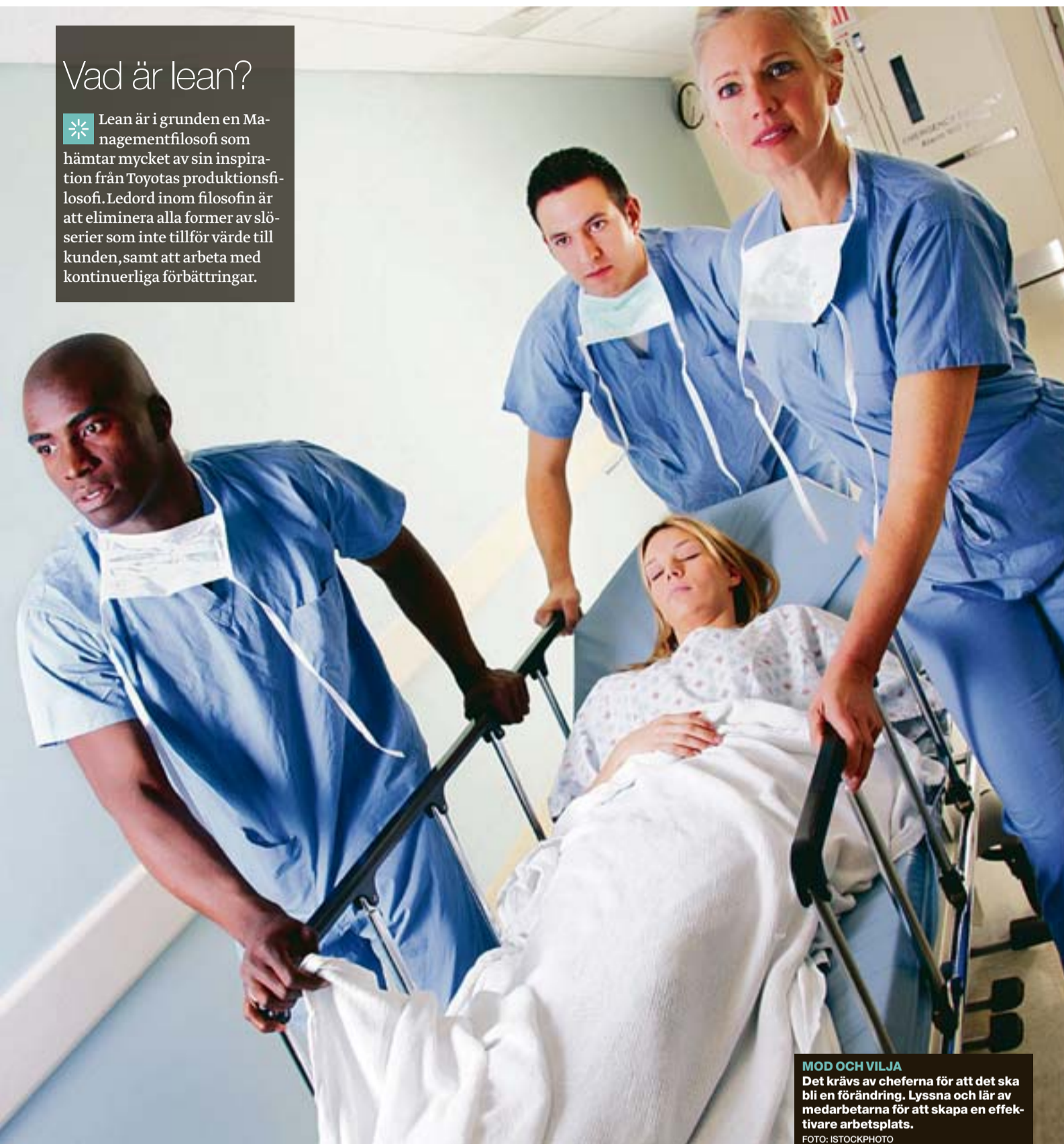
MOD OCH VILJA Det krävs av cheferna för att det ska bli en förändring. Lyssna och lär av medarbetarna för att skapa en effektivare arbetsplats.

* Lean är i grunden en Managementfilosofi som hämtar mycket av sin inspiration från Toyotas produktionsfilosofi. Ledord inom filosofin är att eliminera alla former av slöserier som inte tillför värde till kunden, samt att arbeta med kontinuerliga förbättringar.