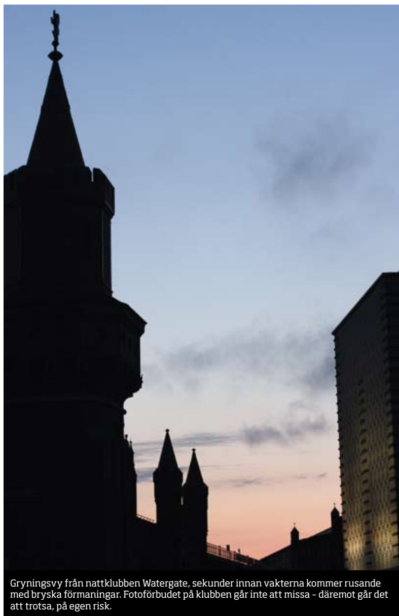
Gryningsvy från nattklubben Watergate, sekunder innan vakterna kommer rusande med bryska förmaningar. Fotoförbudet på klubben går inte att missa - däremot går det att trotsa, på egen risk.