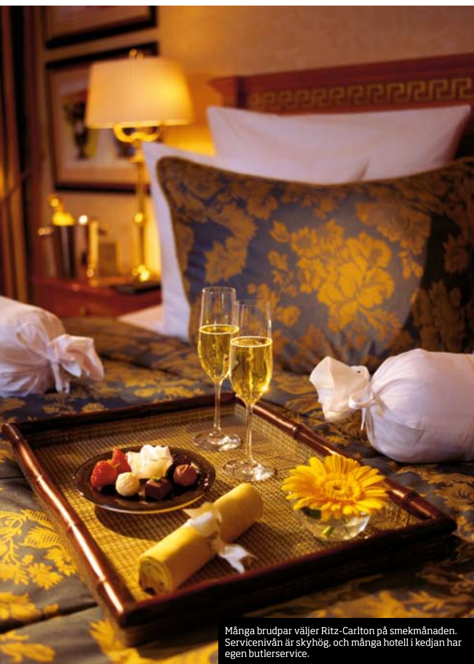
Många brudpar väljer Ritz-Carlton på smekmånaden. Servicenivån är skyhögt, och många hotell i kedjan har egen butlerservice.

kristallkronor, guldfärg och heltäckningsmattor får en att färdas in i villfarelsen om en annan värld – och en annan tid.