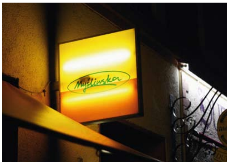
Försök säga "Schlesischestrasse" till taxichauffören efter några drinkar. Om du lyckas har du ett litet koppel av trevliga barer och klubbar att ägna dig åt. Här är Mysliwska.

»...klubben har ett enormt utedäck där vackra nattklubbare minglar, hånglar, röker och byter visitkort till en vacker bakgrund av glittrande gryningssol över floden Spree.«