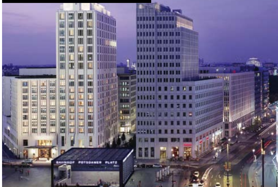
Mitt på Potsdamer Platz tronar The Ritz-Carlton över torget med en överlägsen blick. Det ståtliga lyxhotellet är nämligen inget för alla.

The Ritz-Carlton på Potsdamer Platz omges av höga fönsterskyskrapor, som om begreppet finanskris aldrig myntats. Det samma gäller för insidan av det anrika lyxhotellet: träpanel,